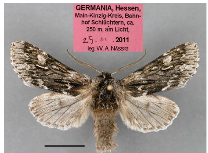
Abb. 1: Der Falter von Brachionycha nubeculosa vom 25. III. 2011 vom Bahnhof Schlüchtern. — Maßstab = 1 cm.

In der Hessensammlung in der Sektion Entomologie II von Senckenberg befinden sich eine ganze Reihe von Tieren: aus der Sammlung von A. WUNDERLICH 2 ♂♂, 1 ♀ von Dornholzhausen im Taunus [= Stadtteil von Bad Homburg v. d. H.] (1 ♂ 26. III. 1956, 1 ♀ 22. III. 1959) und 1 ♂, 1 ♀ vom 15. III. 1966 von Nordheim am Rhein [= Stadtteil von Biblis], also aus der Oberrheinebene; weiter aus der coll. P. M. KRISTAL (Geschenk an die Arge HeLep) 2 ♂♂ vom hessischen Odenwald, Raubach (28. und 30. III. 1989); schließlich von gerade einige km über die Grenze nach NRW 1 ♂ vom III. 1994, leg R. TWARDILLA, via H.-J. FALKENHAHN, aus Südwestfalen, östl. Siegerland, Eichenschälwälder Umgeb. Wilsdorf/Wilgersdorf. Dazu eine kleine Serie aus der coll. P. KAMES (via K. G.