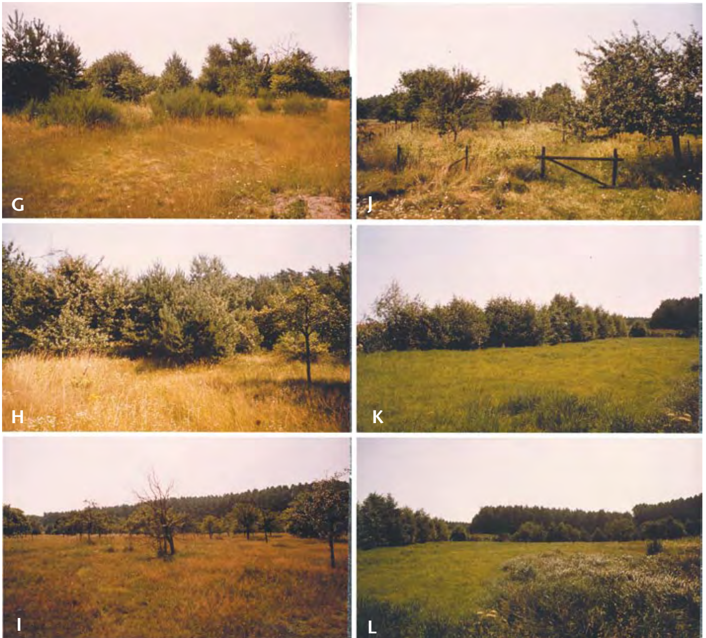
Holunder aus Fig. F. Im Vordergrund sehr schütterer Bewuchs, im Hintergrund dichtere, aber immer noch halbtrockenrasenähnliche Vegetation. (OR 11.) Figs. G–H: Fallenserie III C. G: Blick aus nordöstlicher Richtung auf den westlichen Teil der Serie. Rechts im Bild ist die Gruppe aus zwei alten, teilweise abgestorbenen und umgefallenen Apfelbäumen und jungen, dichten Prunus -Wurzelschößlingen zu sehen, im Vordergrund ein kleiner trockenheißer Bereich mit lückiger Vegetation auf Sand. (OR 18.) H: Blick auf den hinteren, östlichen Bereich. Angeflogene Pinus sylvestris überwachsen die Obstbäume und schließen im Hintergrund den Bereich fast vollständig ab. An dem kleinen Apfelbaum rechts im Vordergrund ist Falle Nr. 1 zu erkennen. (OR 19.) Fig. J: Fallenserie III E, Blick aus östlicher Richtung auf das damals eingezäunte Grundstück (auf Veranlassung des Magistrats der Stadt Mühlheim am Main mußten inzwischen alle Grundstückszäune auf dem Gailenberg entfernt werden) mit angelegter blütenreicher Bienenweide. Im Vordergrund rechts der Apfelbaum, in dessen weiter Krone insgesamt 11 Fallen angebracht waren. (OR 14.) Figs. K–L: Fallenserie III D. K: Blick aus Nordwest auf den nördlichen Teil der hohen, grabenbegleitenden Hecke mit den Fallen. Links ist der Aussiedlerhof zu erkennen. Im Vordergrund die Mähwiese. (OR 20.) L: Blick von fast demselben Standpunkt wie in Fig. K nach Süden. Zu sehen sind der Zaun der Rinderkoppel, dahinter der in ostwestlicher Richtung verlaufende Teil des Grabens mit der begleitenden Hecke, ganz im Hintergrund der Waldrand. Im Vordergrund rechts ein tiefer gelegener Teil der Mähwiese, der durch die hohen Niederschläge 1981 wegen Überflutung nicht mit schwerem Gerät bewirtschaftet werden konnte und deshalb mit hohen Gräsern bestanden war. (OR 21.)

durch MASCHWITZ und PRIESNER an seiner Diplomarbeit arbeitete, konnte (allerdings mit unterschiedlichen Pheromonmischungen) allein 12 Noctuidae-Arten, daneben noch 1 Lymantriide und 2 Geometridae in seinen Fallen feststellen (SCHROTH 1982 [unveröff.]: 98–101). Jedoch dürfte nur ein Teil dieser Arten tatsächlich auf Pheromonteilkomponenten reagiert haben; bei den übrigen Arten waren es nur Einzelstücke (darunter auch ♀♀). Mehrfach stimmten Beifangergebnisse meiner Untersuchungen mit denen von SCHROTH (1982 [unveröff.])